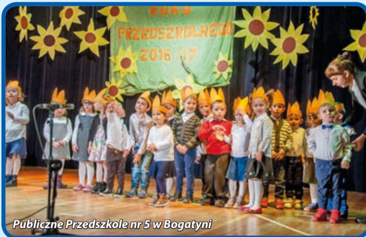
Publiczne Przedszkole nr 5 w Bogatyni