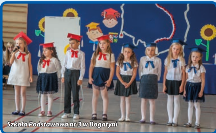
Szkoła Podstawowa nr 3 w Bogatyni