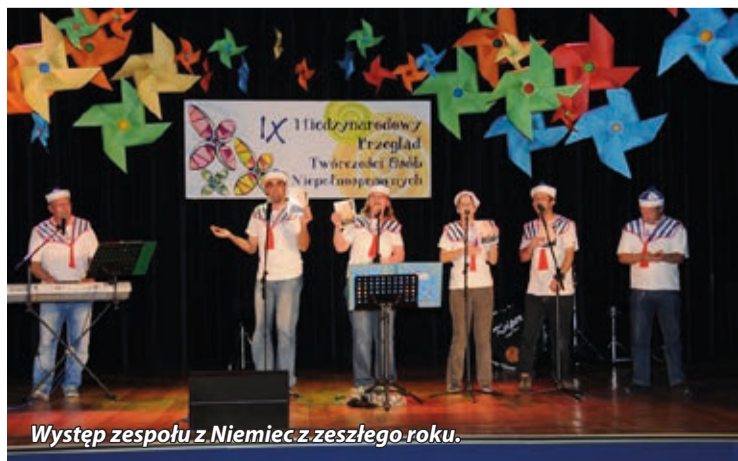
Występ zespołu z Niemiec z zeszłego roku.

Zapraszamy na wyjątkowe spotkanie artystyczne! Wstęp wolny.