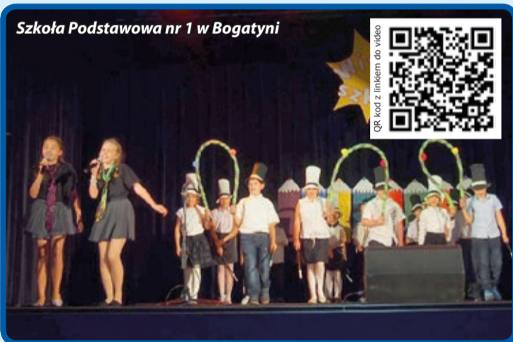
Szkoła Podstawowa nr 1 w Bogatyni