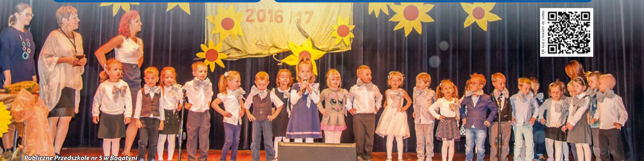
Publiczne Przedszkole nr 5 w Bogatyni