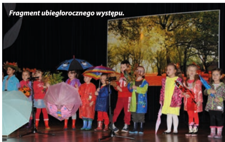
Fragment ubiegłorocznego występu.

Serdecznie zapraszamy na wesołe spotkanie z dźwiękami i kolorami jesieni.