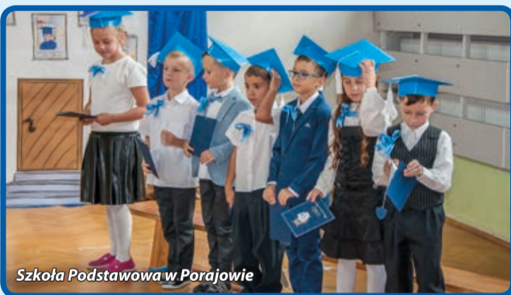
Szkoła Podstawowa w Porajowie