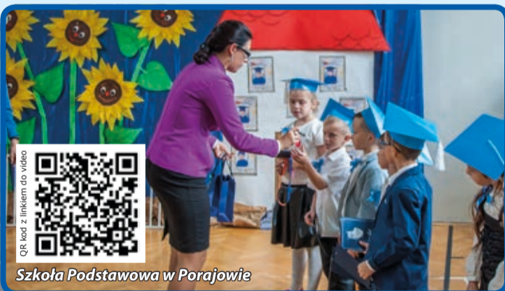
Szkoła Podstawowa w Porajowie