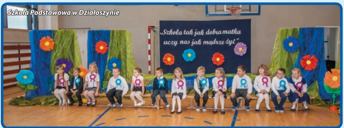
Szkoła Podstawowa w Działoszynie