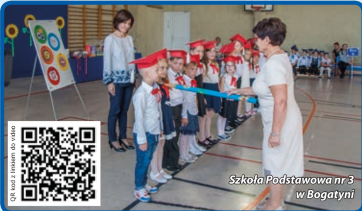
Szkoła Podstawowa nr 3 w Bogatyni

Jak na uroczystość przystało nie zabrakło prezentów i upominków. Pierwszoklasiści otrzymali odbłaskowe światełka, które poprawią ich widoczność i bezpieczeństwo w drodze do szkoły.