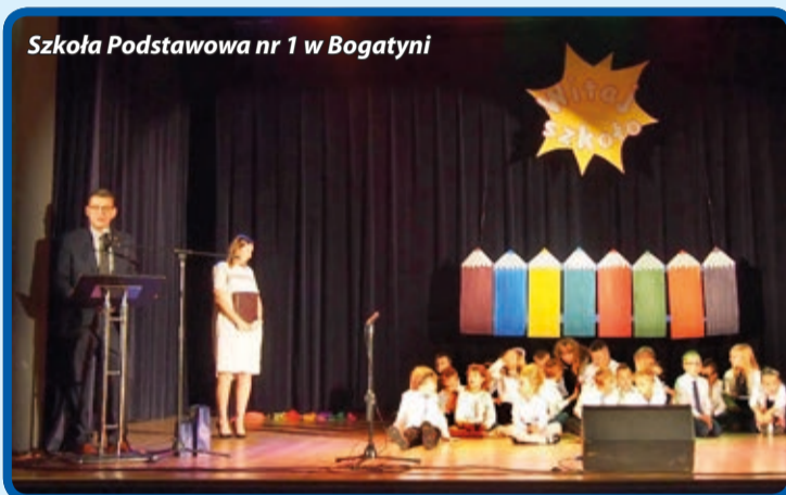
Szkoła Podstawowa nr 1 w Bogatyni