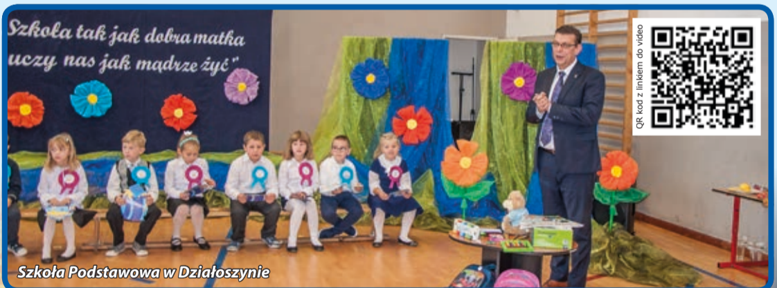
Szkoła Podstawowa w Działoszynie